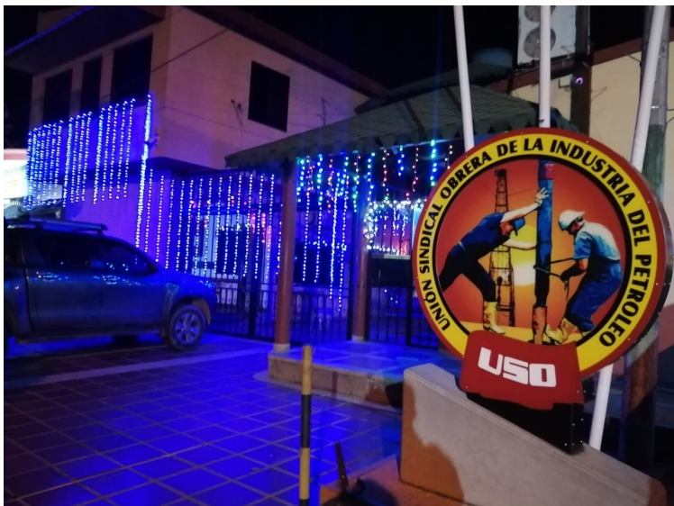
Fachada de la sede sindical en época decembrina.

Para la navidad y fin de año del 2020, la Subdirectiva Arauca también se vio obligada a modificar las actividades que regularmente para estas fechas se realizaban, pues es elemental evitar las aglomeraciones dadas en eventos como fiestas. Esto sin embargo, no es impedimento para llevar a los afiliados un souvenir que ha sido planeado con el objetivo de alimentar el espíritu navideño en familia.